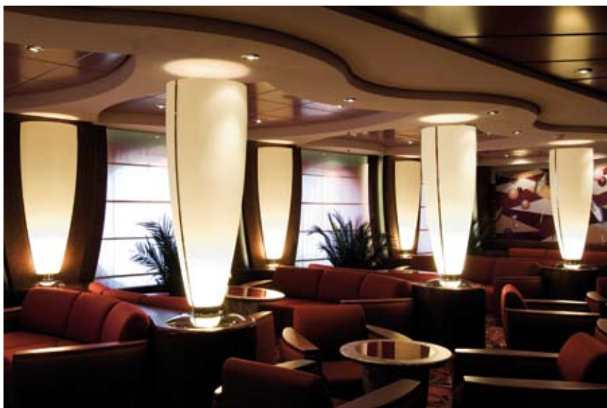
Oben: Shakerlounge | Unten: Reception der MSC Orchestra.